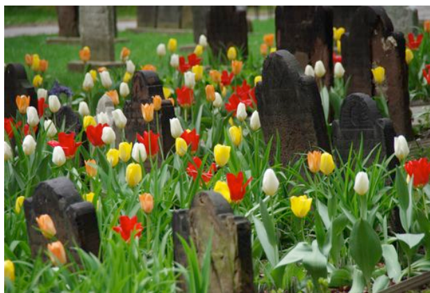
Friedhof der Trinitychurch, Nähe Ground Zero

Zwei Tage nach dem Attentat auf das World Trade Center in Manhattan fand man bei Bergungsarbeiten zwei zu einem Kreuz verkeilte Stahlträger. Dieses eiserne Kreuz von Ground Zero wurde zu einem Symbol für Glaube, Hoffnung und Heilung.